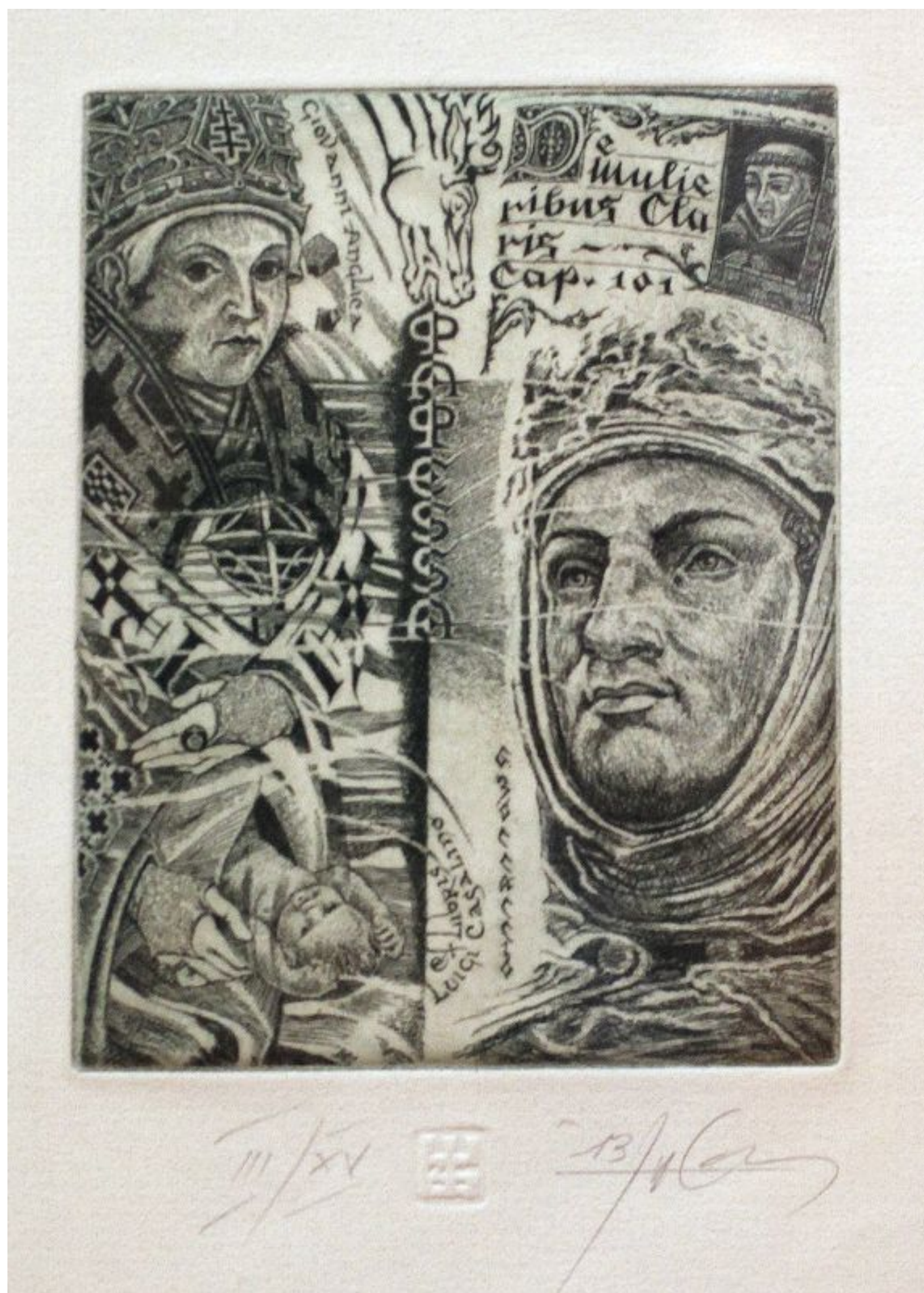
[3]A könyv már az ókortól értékes tárgynak számított, birtoklása tekintéllyel járt, ezért gondosan