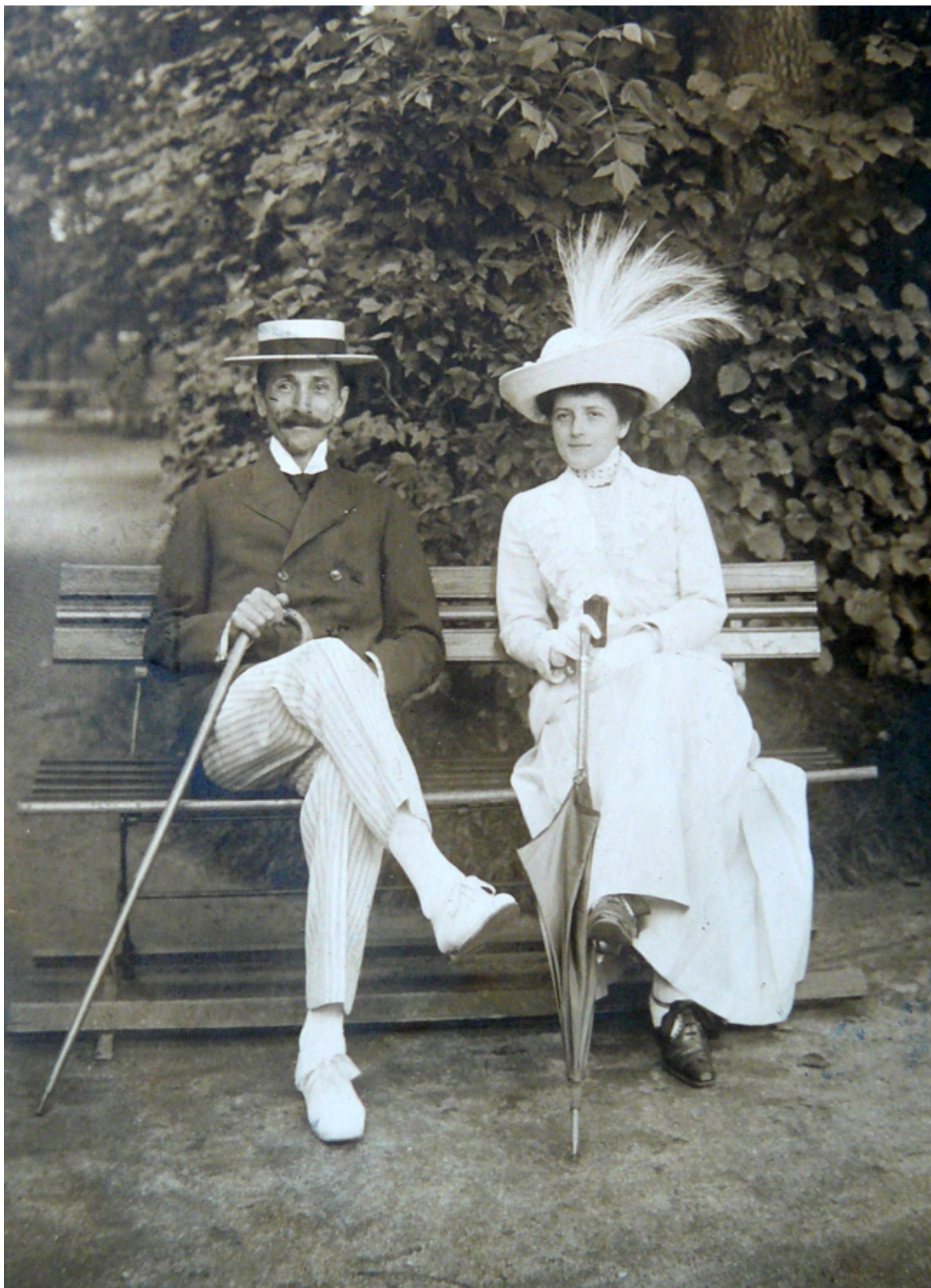
[1] Régi adósságot törleszt az Országos Széchényi Könyvtár, amikor Todoreszku Gyula páratlan értékű könyvtáráról készül első ízben kiállítást rendezni. A jelentőségében Széchényi Ferenc és