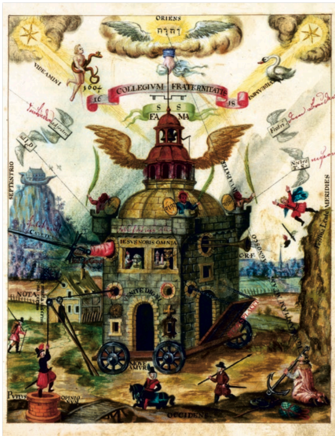
[1] A Ritman Library művelődéstörténeti kiállítása az Országos Széchényi Könyvtárban

Februártól egyedülálló vándorkiállításnak ad otthont a nemzet könyvtára. A hermetikus filozófia irodalmának gyöngyszemei, 400 éves, klasszikus rózsakeresztes iratok kerülnek bemutatásra, melyek egykor a művelt európai világot „általános, világméretű reformációra” szólították fel.