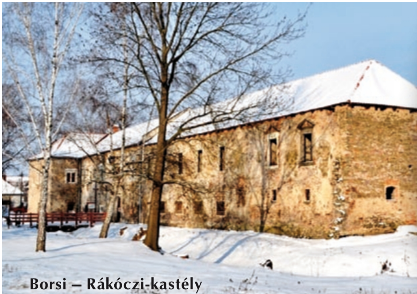
Borsi – Rákóczi-kastély

Április 12. és 13. között a Teleki László Alapítvány könyvtárunkban tartja a Rómer Flóris terv - Megújuló magyar műemlékek a Kárpát-medencében című konferenciáját.