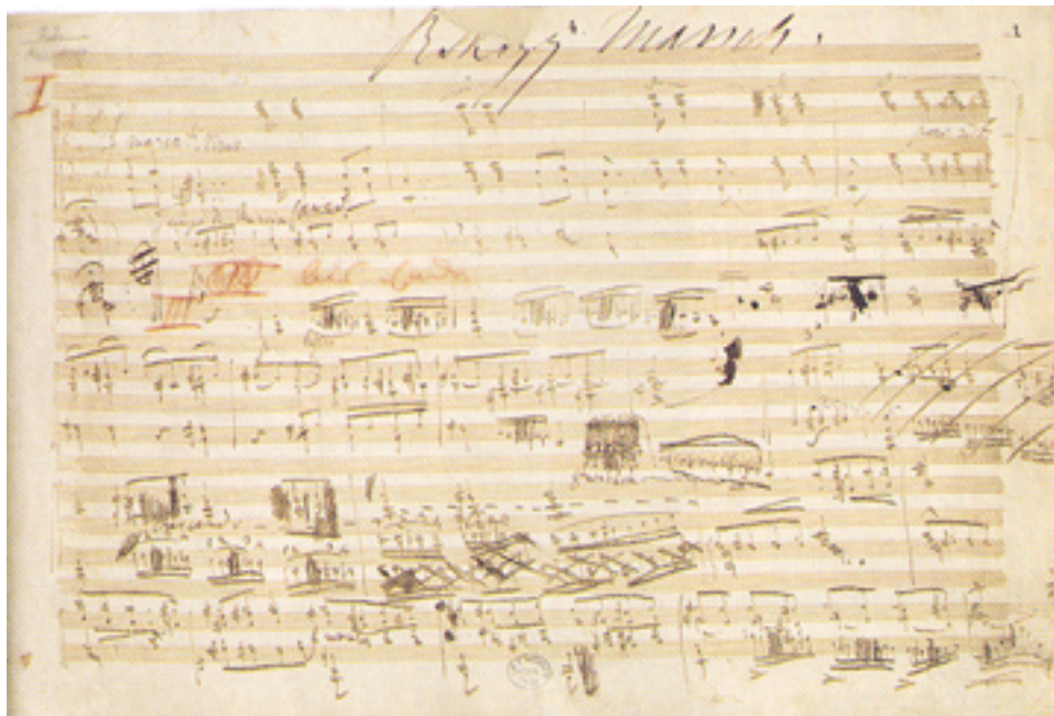
[4] Liszt Ferenc szerzői

kéziratai közül csaknem félszáz található gyűjteményünkben, amely emellett számos, a zeneszerző keze vonását őrző korrektúrapéldányt, kottanyomtatványt és levelet is tartalmaz. Liszt-leveleket a Kézirattárban is találhatnak olvasóink.