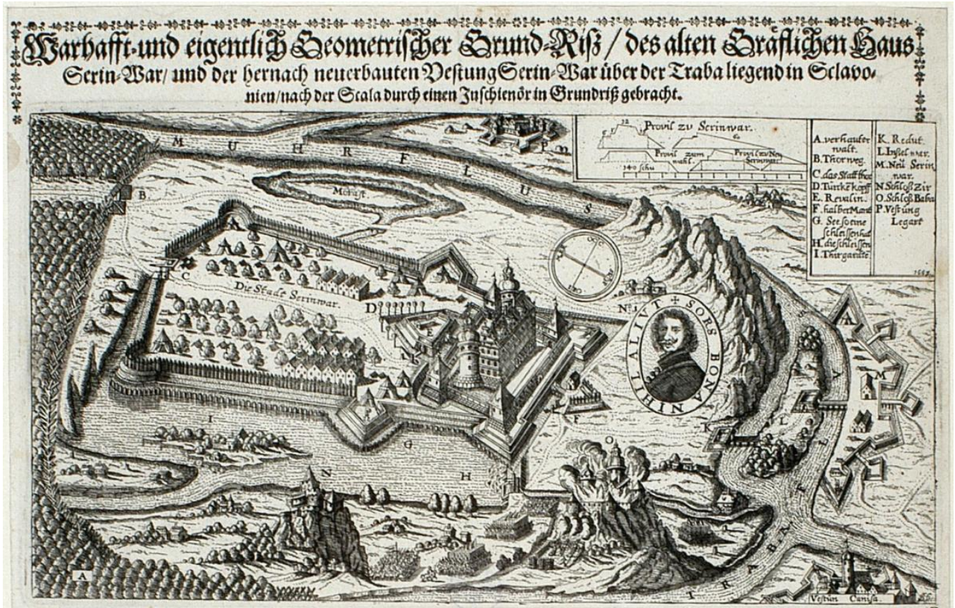
[17] Új-Zrínyivár és Csáktornya madártávlati képe. Nürnberg. 1663 (OSZK RNYT. App. M. 342) [18]