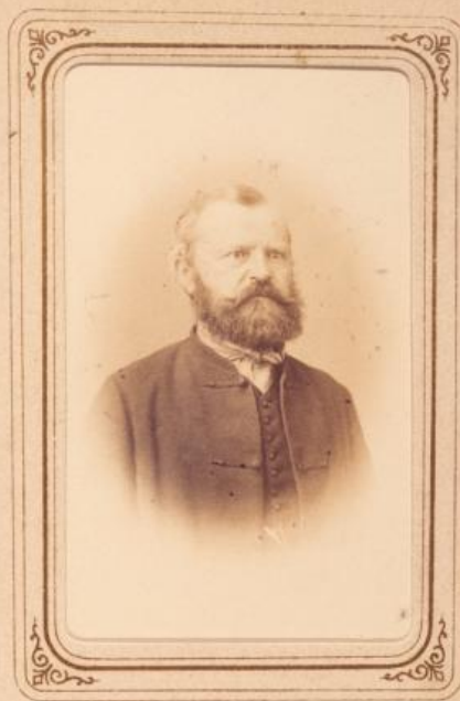
22. MAILÁTH GYÖRGY (Szekhelyi),