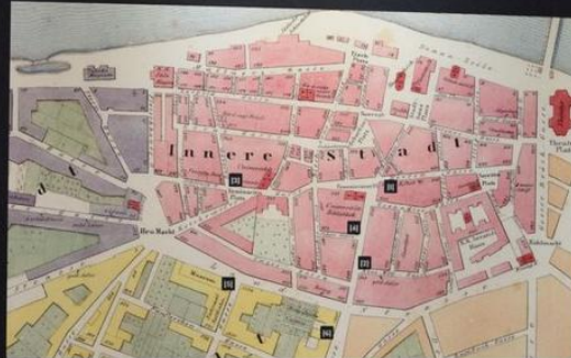
Carl Langner: Budapest Pest, 1848. március 15. (Nemzeti Színház helye látható)