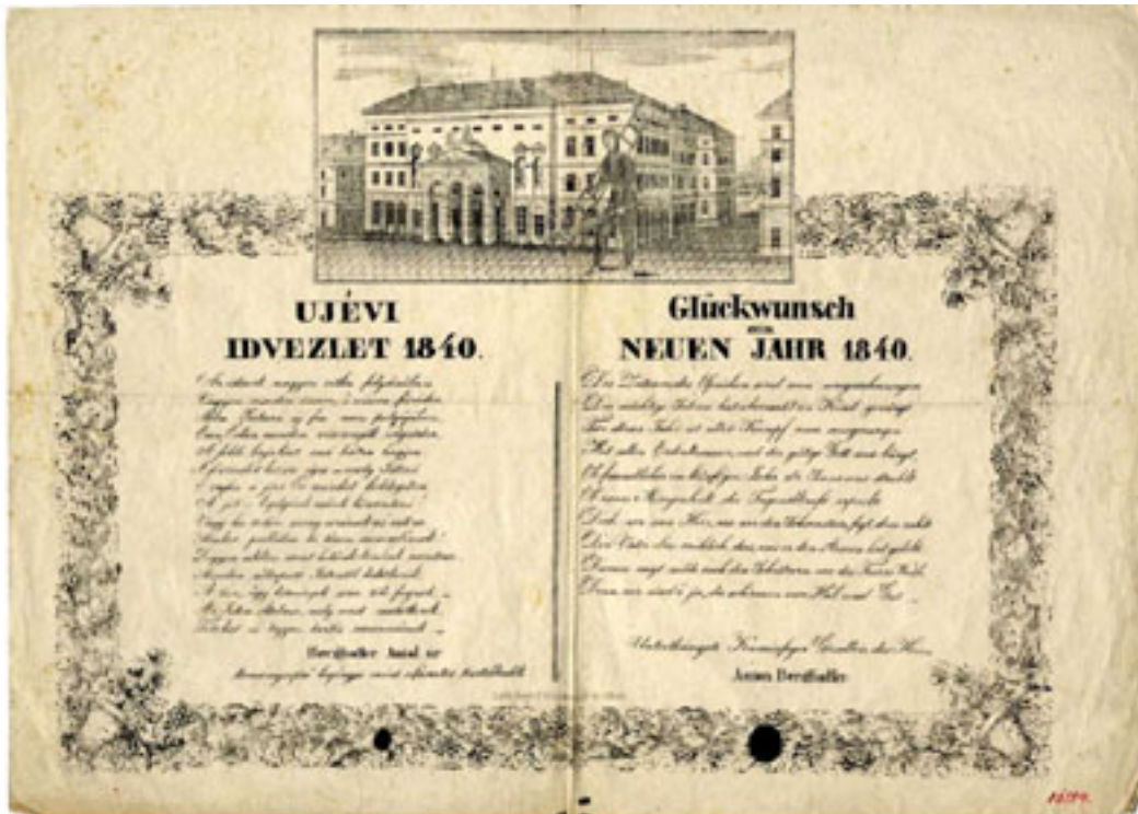
[6]A német nyelvű