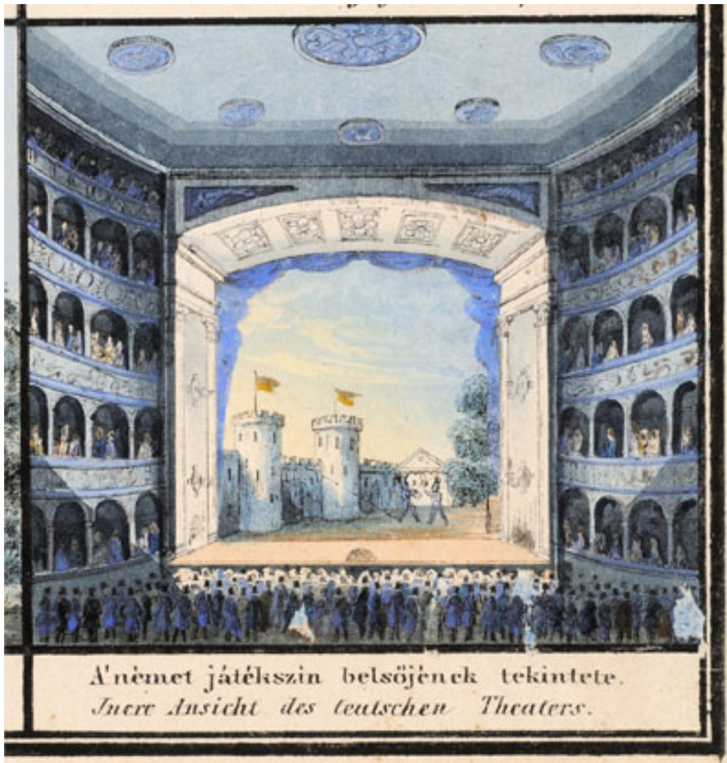
A német játékszin belsőjének tekintete. Inere Ansicht des deutschen Theaters.