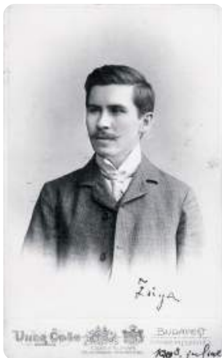
Móricz Zsigmond, 1903

A Digitális Bölcsészeti Központ által újonnan fejlesztett platform, a dHUpla – dhupla.hu (Digital Humanities Platform) elsősorban digitális szövegkiadások publikálására jött létre. A korszerű felület a közgyűjteményekben őrzött legkülönbözőbb szöveges források közzétételére ad lehetőséget, s egységes kutatói környezetet jelent az irodalomtudomány, a nyelvtudomány és más humán tudományok számára. A szövegkiadások céljuknak megfelelően eltérő szintű filológiai feldolgozással, más-más megjelenítéssel, lekérdezési funkciókkal készülnek. A Móricz Zsigmond-levelezés kritikai kiadása, illetve Kiss József levelezésének forráskiadása jól illusztrálja a digitális közegbe helyezett szövegtörzsek hagyományos és újszerű felhasználhatóságának, kutathatóságának lehetőségeit, a hosszú távú megőrzés szempontjait, a hálózatoság előnyeit, illetve egy digitális szövegkiadás kapcsán előálló strukturált adathalmaz feldolgozásának módjait. A platformon elérhető úgynevezett kreatív tartalmak közül a Móricz Zsigmondhoz és Kiss Józsefhez kapcsolódó legújabb adatvizualizációk a nagyközönség számára is érdekes eredményekkel szolgálnak, ugyanakkor a kutatók számára is egészen új szempontok, stratégiák felé nyitnak meg új kapukat.