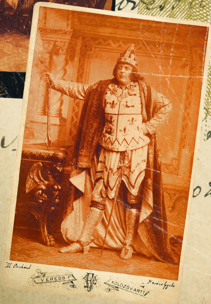
BUDAPEST - KORONÁHERCEG U. 8.