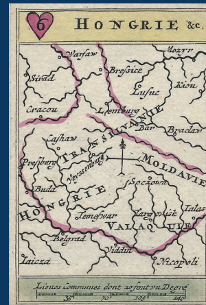
Játékkártyák, 1710 körül Dr. Ovidiu Șandor magángyűjteménye, Temesvár

A kiállítás 70 értékes, gyakran első alkalommal kiállított darabja a Duna menti térség térképészetének fejlődését mutatja be 1650 és 1800 között. A kiállítás alapjául az a térképekből és látképekből álló gazdag gyűjtemény szolgált, amelyet a bádeni örgrófok katonai, hadászati célokból hoztak létre. A tárlatot az Institut für donauschwäbische Geschichte und Landeskunde (Dunai Sváb Történelem és Országismeret Intézet), valamint magánadományozók gyűjteményéből származó darabok gazdagítják.