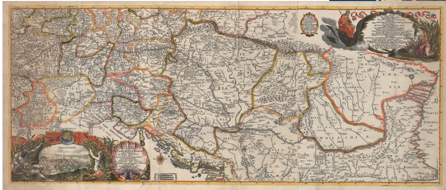
A Duna – forrástól a torkolatig, 1683

Az újonnan készített Duna-térképek körmönfont módon legitimálták a hatalmi igényeket és a kulturális függőségi viszonyokat. A pogány és barbár törökökről alkotott ellenségkép szintén ezen az úton terjedt el nagyon gyorsan. Nem utolsósorban ez jelentette a térképkészítők hatalmát, akik felfedezték a Duna menti térséget.