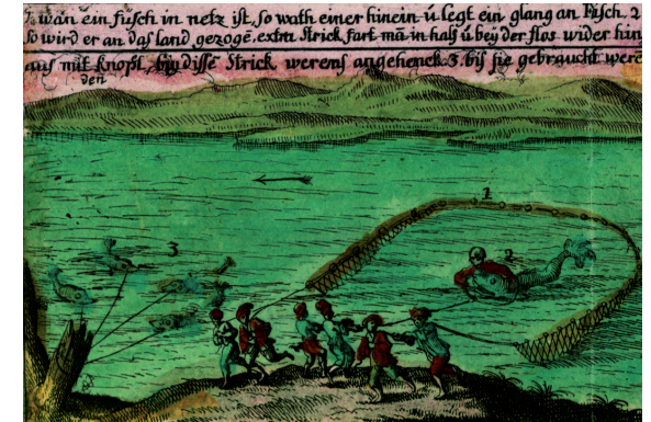
Vizahalászat a Dunán Komáromnál, 1738 után Dr. Ovidiu Șandor magángyűjteménye, Temesvár

A kiállítás 70 értékes, gyakran első alkalommal kiállított darabja a Duna menti térség térképészetének fejlődését mutatja be 1650 és 1800 között. A kiállítás alapjául az a térképekből és látképekből álló gazdag gyűjtemény szolgált, amelyet a bádeni örgrófok katonai, hadászati célokból hoztak létre. A tárlatot az Institut für donauschwäbische Geschichte und Landeskunde (Dunai Sváb Történelem és Országismeret Intézet), valamint magánadományozók gyűjteményéből származó darabok gazdagítják.